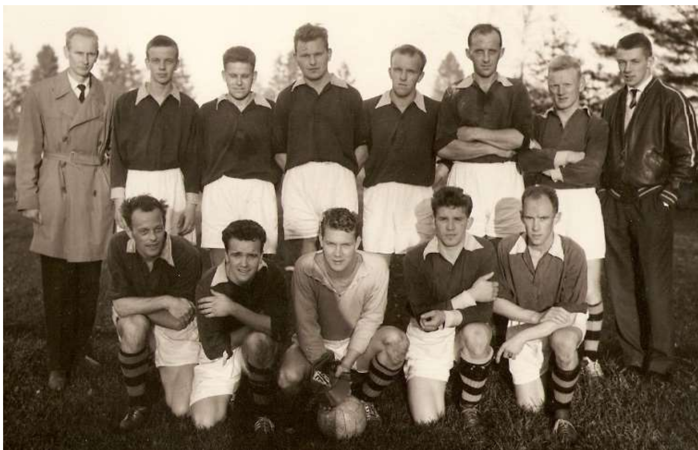
FORSHAGAS DIV 3 LAG 1959