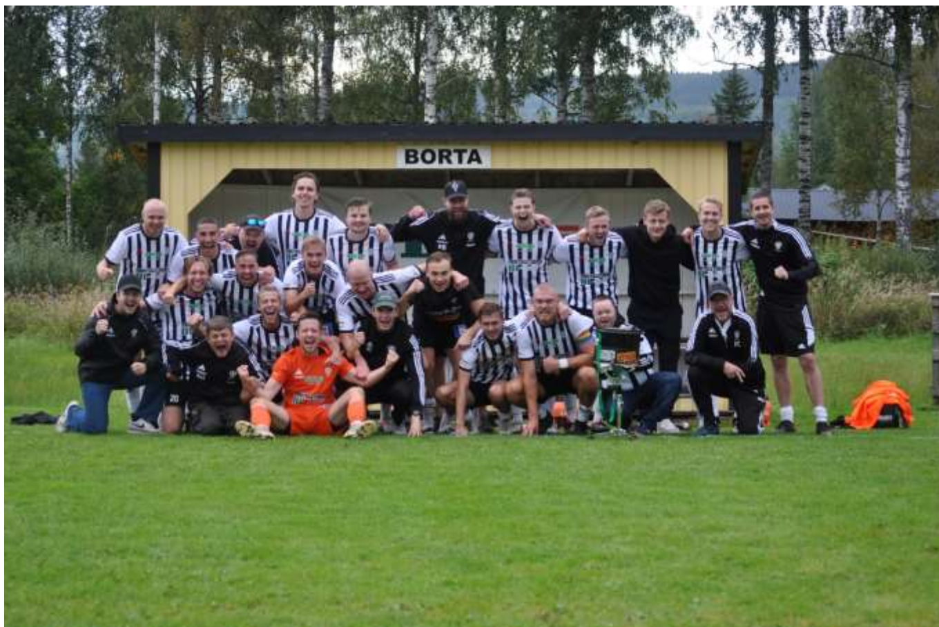
FORSHAGA SERIESEGRARE DIV 4 2023